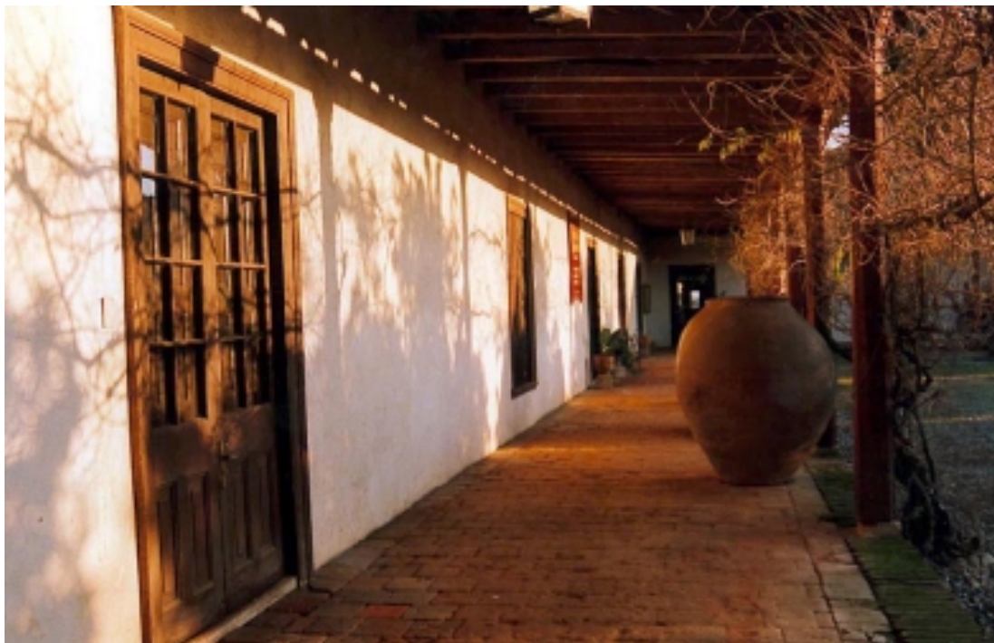
MUSEO HUILQUILEMU - TALCA