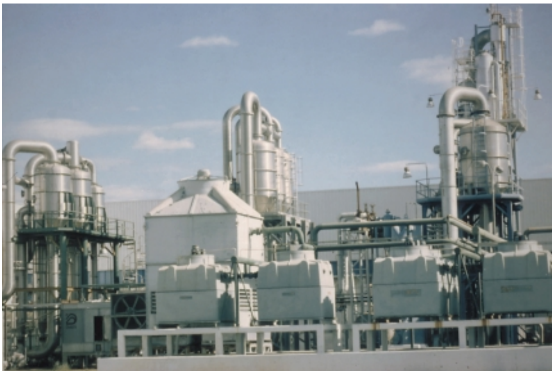
PLANTA IANSAGRO, TALCA

En este plano, en el siguiente cuadro se identifican las principales fortalezas regionales, vinculadas al ámbito de la infraestructura y ordenamiento territorial, desarrollo productivo y medio ambiente, desarrollo social/cultural y recurso humano, clasificación que se adopta sólo con fines analíticos, ya que en la realidad muchas de ellas están fuertemente interrelacionadas y tienen incidencia en más de un aspecto del desarrollo regional.