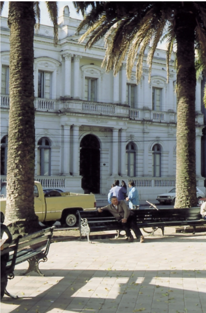
PLAZA DE CURICO

Por otra parte, al disponer de la información precisa de cada una de las iniciativas que conforman el Convenio, la primera autoridad de la Región, establece un compromiso público de gestión de las principales iniciativas estratégicas, con resultados concretos a alcanzar en el período de un año, compromiso que deberá tener una vasta difusión. Al final del período, se rinde una cuenta pública por parte del Intendente y por parte de cada Presidente de las Comisiones del Gabinete Regional, en función de los compromisos adquiridos, lo que permitirá la participación ciudadana en el control y seguimiento de la ERD.