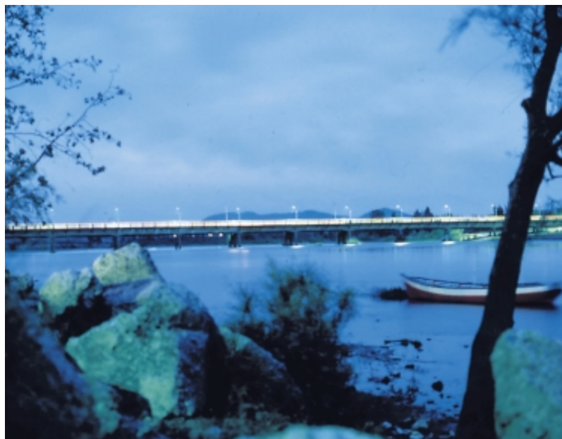
PUENTE RIO CLARO - TALCA