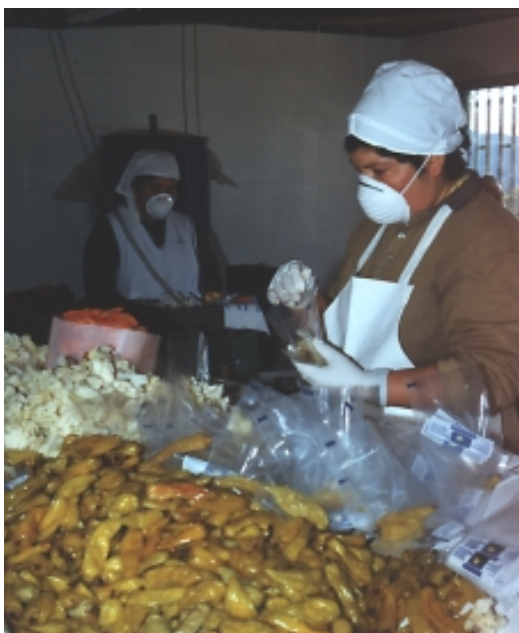
VILLA PRAT, AGROINDUSTRIA DE ENCURTIDOS

En un marco de creciente apertura e integración económica, ningún territorio está exento de las influencias múltiples que ejercerán sobre él tendencias provenientes del ámbito internacional, nacional e incluso regional, sean estas de políticas, económicas,