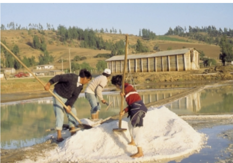
SALINAS DE BOYERUCA