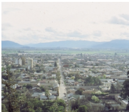
CIUDAD DE TALCA

Las prioridades que la región deberá desarrollar en cada uno de estos ámbitos, para superar la brecha entre la situación actual y el escenario deseado en el largo plazo, están representadas por los desafíos y lineamientos estratégicos. En este marco, los lineamientos estratégicos o políticas regionales corresponden a las pautas