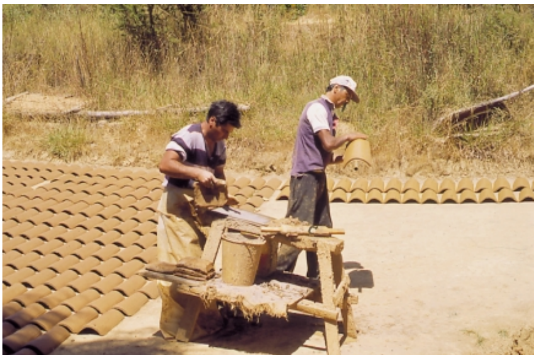
CONFECCION DE TEJAS, CAUQUENES

Finalmente, la ERD representa una oportunidad para