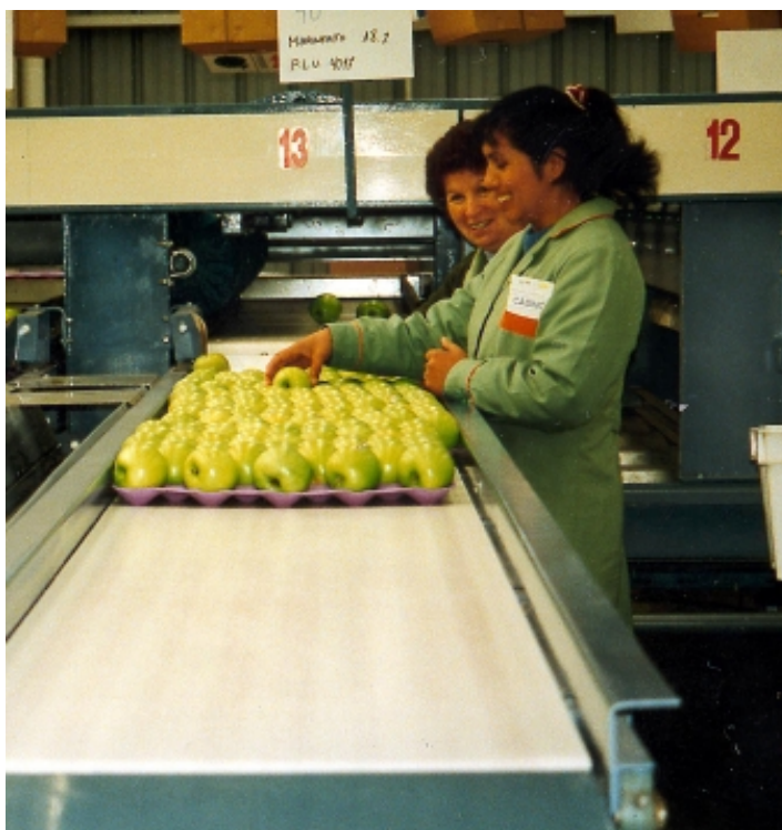
EMPRESA EXPORTADORA DE MANZANAS

número de mercados, así como el número de productos, aún son sólo tres los productos que concentran cerca del 80% de las exportaciones: fruta fresca, productos agroalimentarios y celulosa (véase Anexos 6 y 7).