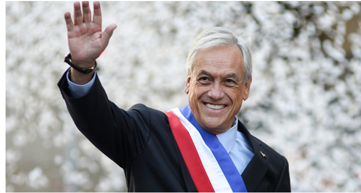
Sebastián Piñera Echenique, 11 de Marzo de 2018